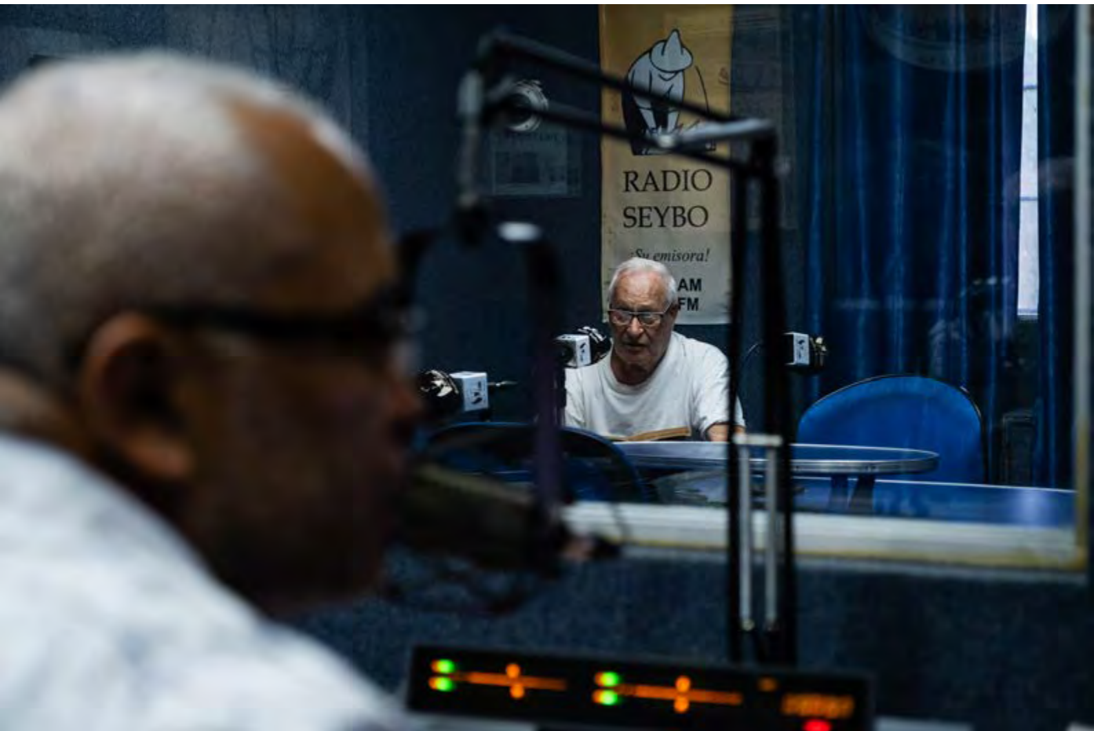
"Por y para la comunidad" . República Dominicana. David Naval. 1er Premio.