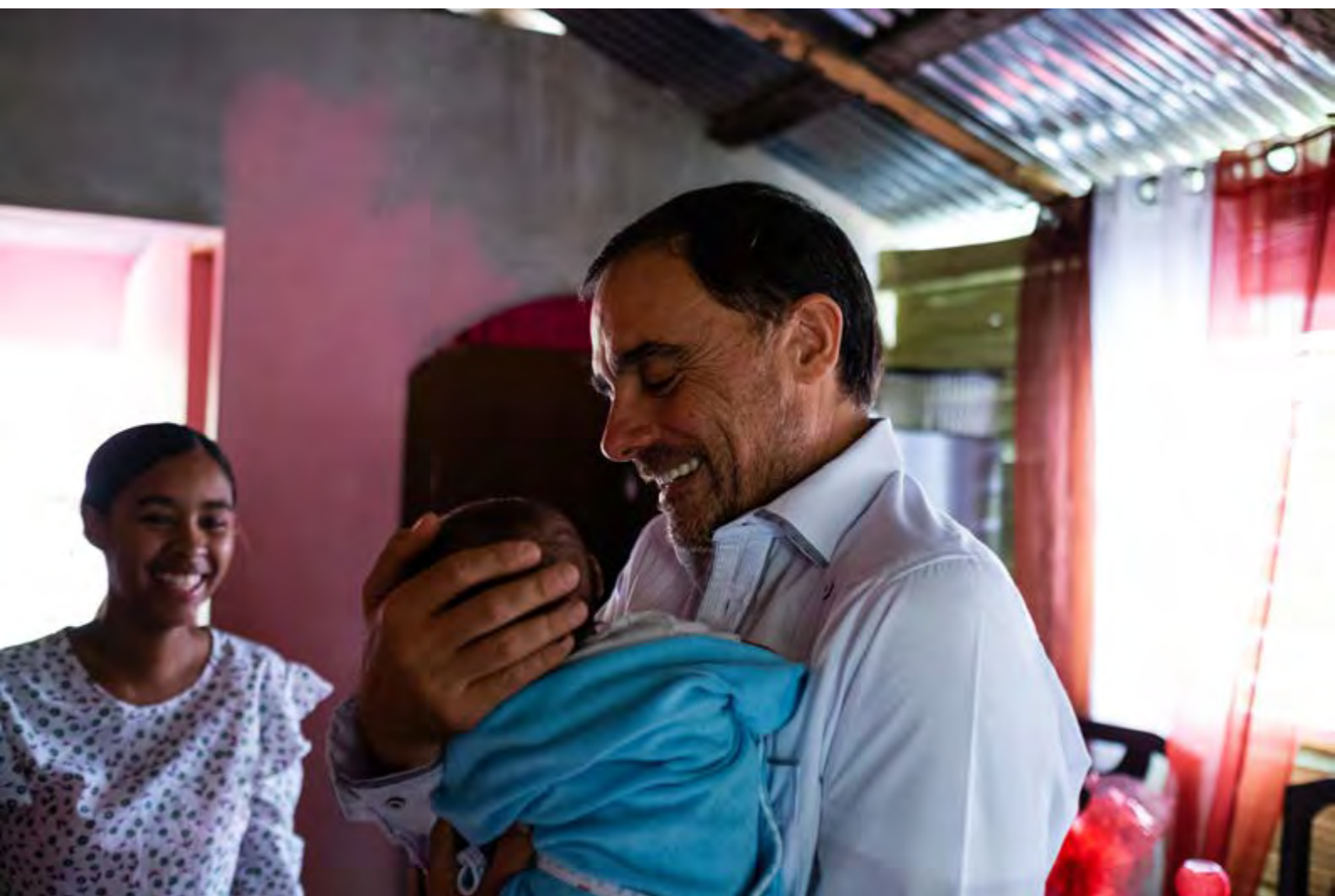
"La ternura de los misioneros" . República Dominicana. David Naval. 1er Premio.