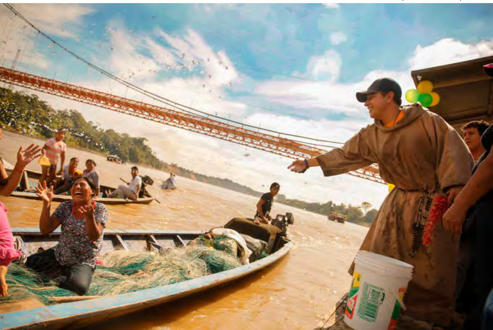
"Contaminación por el mercurio en la explotación del oro". Perú. Pavel Vladimir Martiarena. 2do Premio (Accésit Nivel 1)