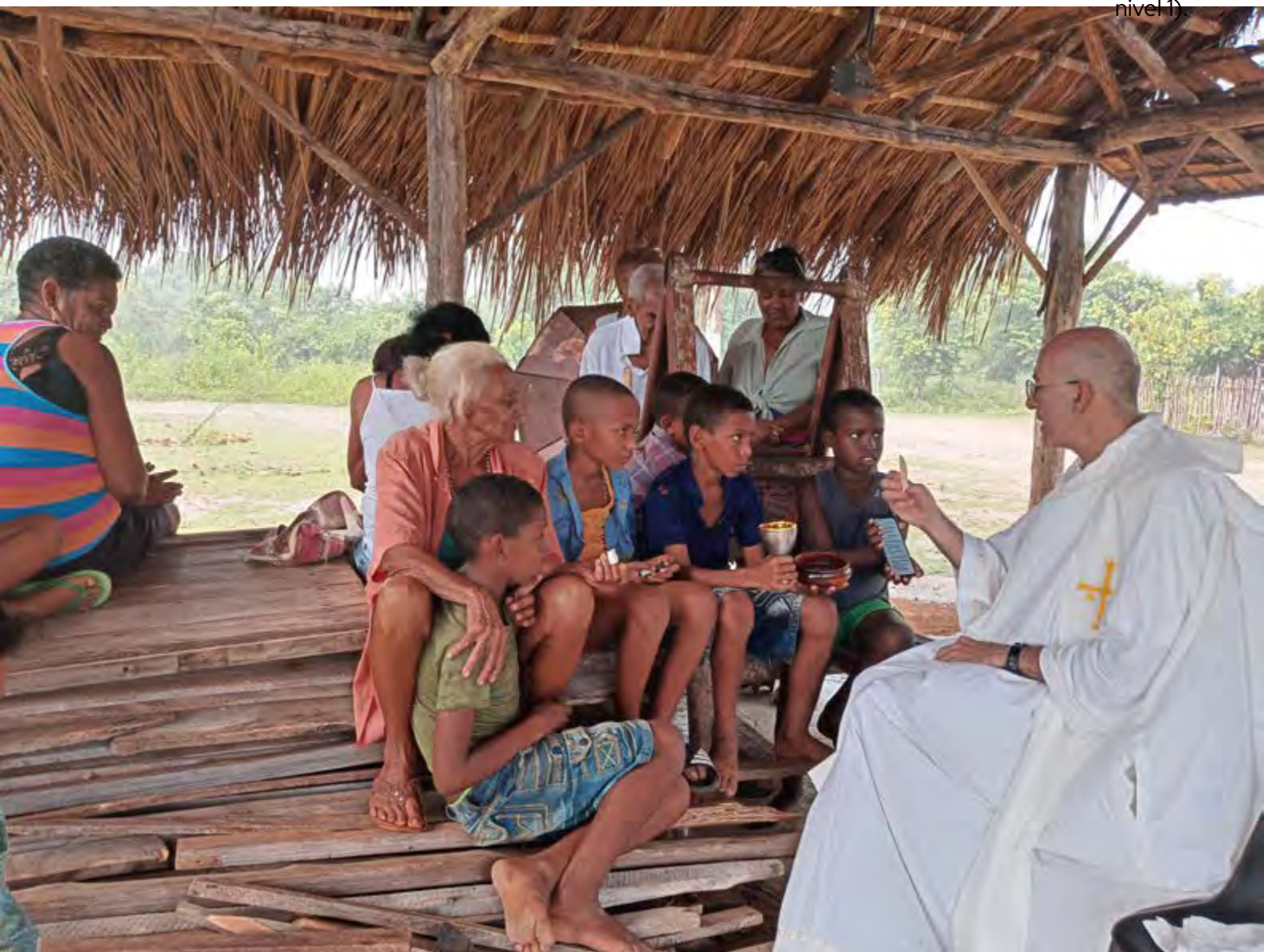
"Eucaristía en medio de un aguacero torrencial". Cuba. Dailis Lázara Izarra Barrizonte. 2do Premio (Accésit nivel 1)