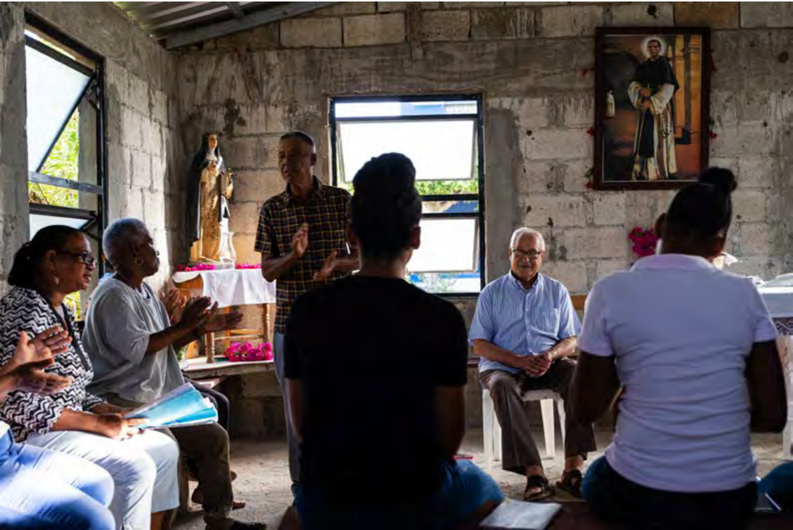
"Sentido comunitario" . República Dominicana. David Naval. 1er Premio.