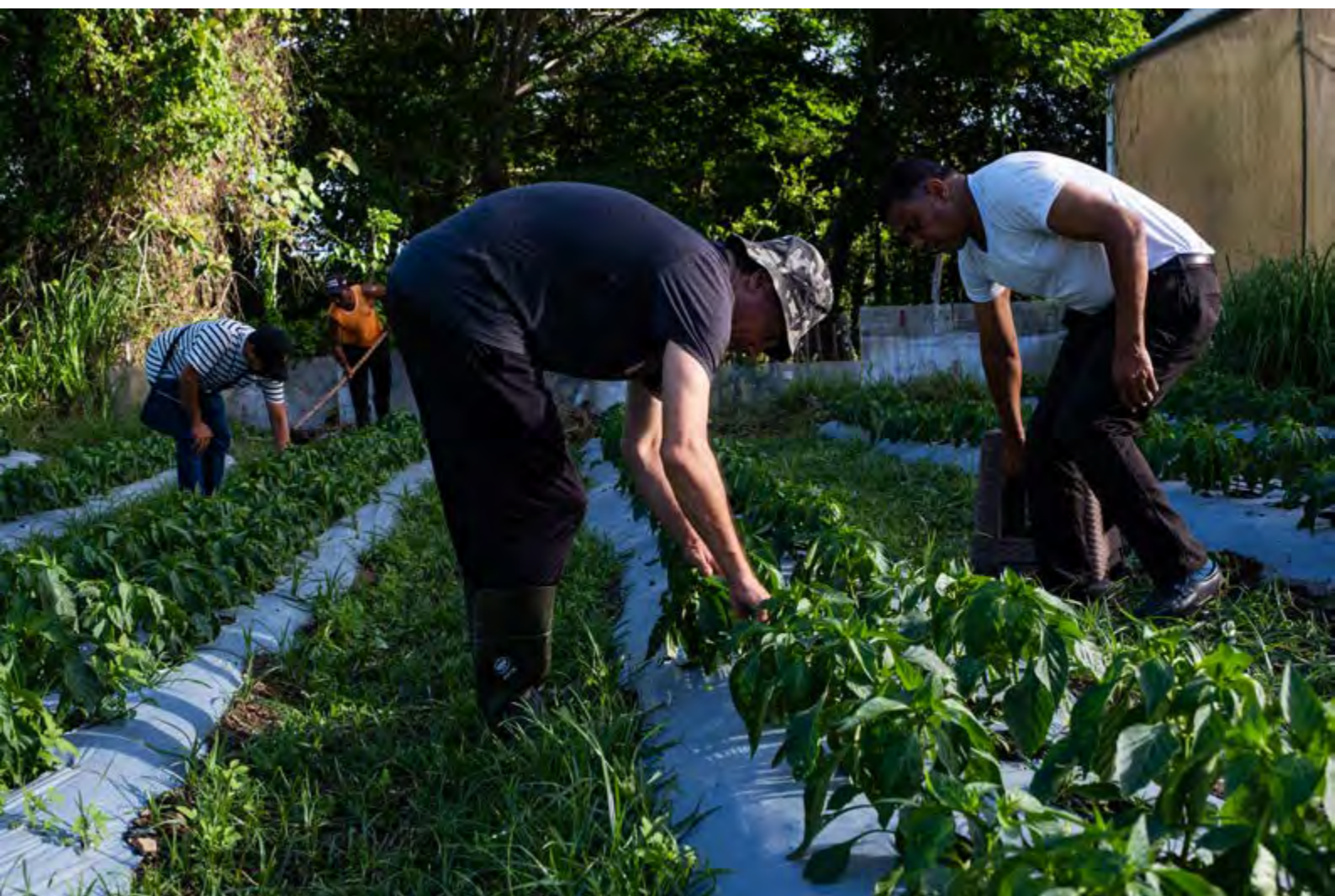
"Salió a sembrar". República Dominicana. David Naval. 1er Premio.