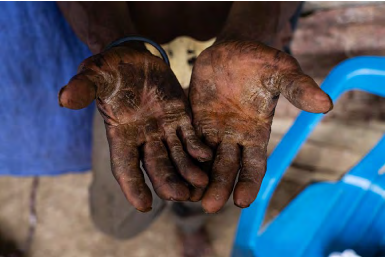
"Duro trabajo" . República Dominicana. David Naval. 1er Premio.