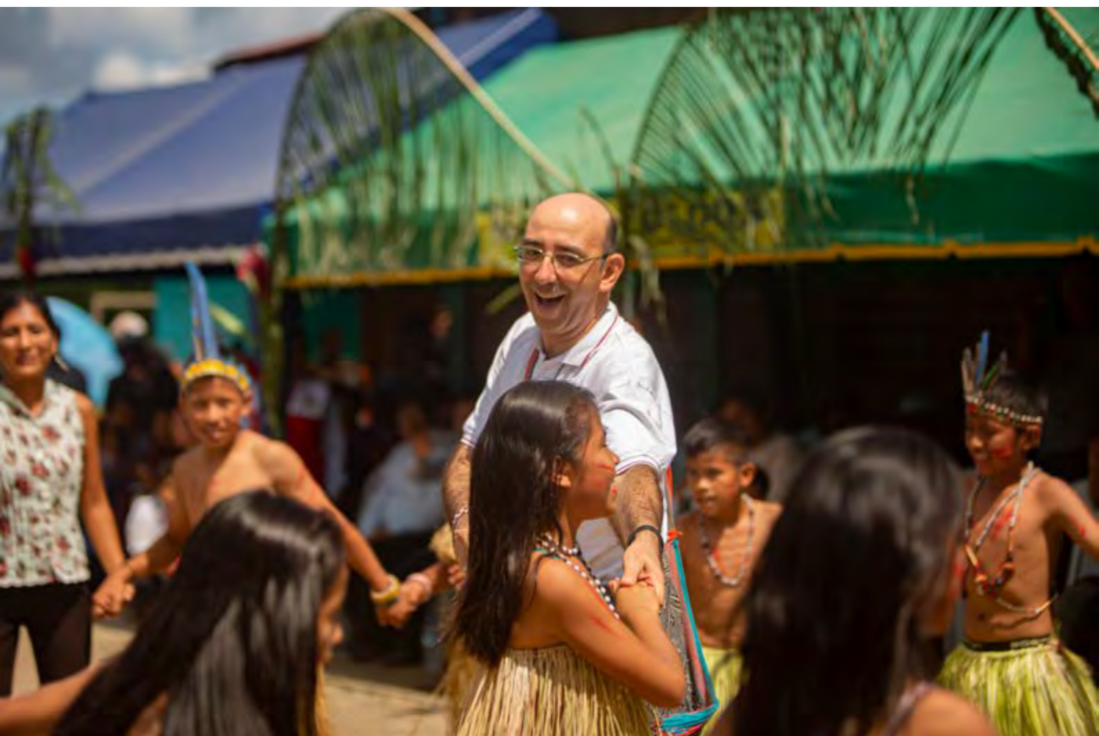
"Riqueza cultural." . Perú. Pavel Vladimir Martiarena. 2do Premio (Accésit Nivel 1)