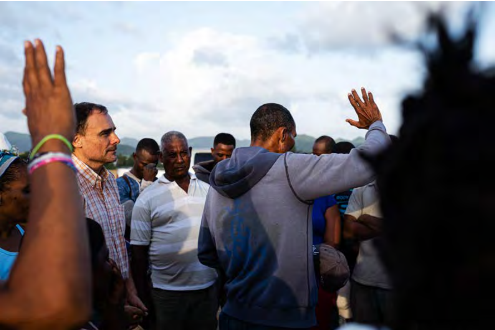
"Asamblea comunitaria" . República Dominicana. David Naval. 1er Premio.