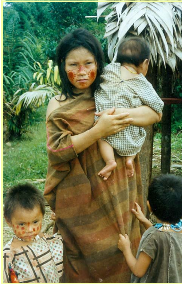
Indígenas de Kirigueti

En el día Internacional de los Pueblos indígenas se saluda a todos los miembros de los Pueblos indígenas y se expresa su reconocimiento a las personas y organi-