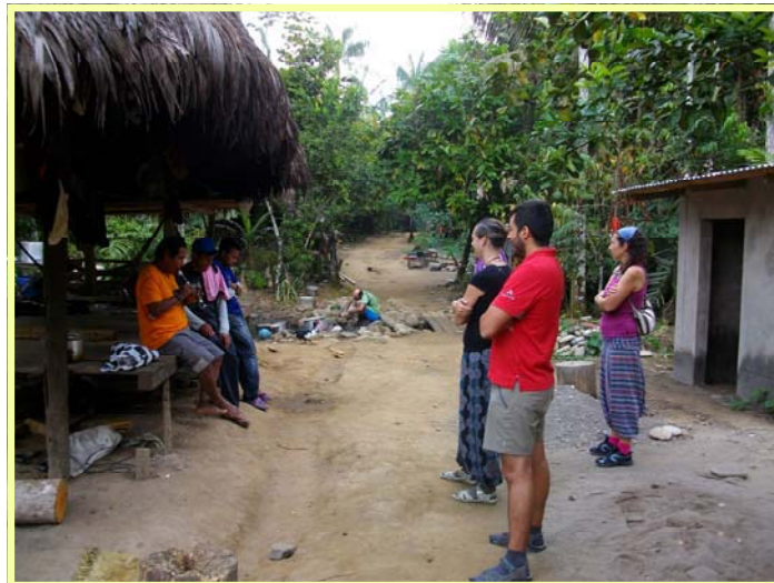
Visita a Kotshiri