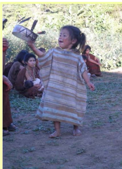
Todos disfrutamos la Navidad

ció su maravilloso ministerio por espacio de 40 años. Le preocupaba la corrupción moral de Judá y las inmensas infidelidades de un pueblo del cual fue el responsable directo. Isaías