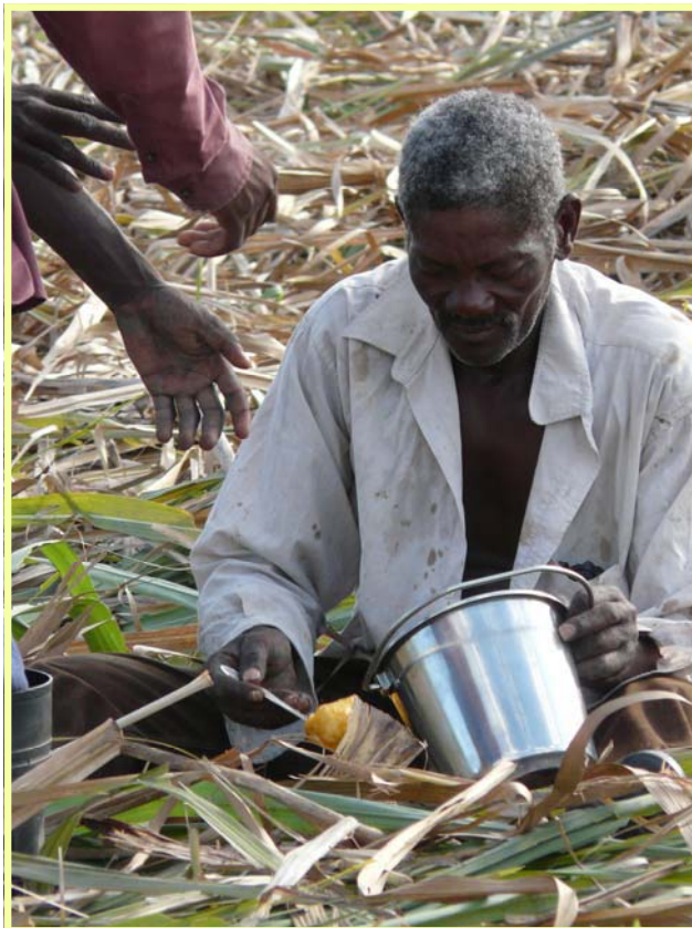
Haitiano trabajador en el Seybo

El hambre, que aquí tiene muchos rostros conocidos. Ayer vino el hijo de una limpiadora del colegio al turno de tarde, estaba sin comer y como alicaído. Le preguntó la profesora y le dijo que no había comido, así que la hermana Carmela le dio un par de bizcochos de los del desayuno del Gobierno (bendito desayuno). Luego cuando vino su madre a limpiar le preguntó, y dijo que sí, que no tenía nada que darle, que han retrasado el pago del sueldo, y en el colmado (supermercado) no le fían porque ya tiene bastante deuda, así que el niño de 6 años lo único que había comido en todo el día era el