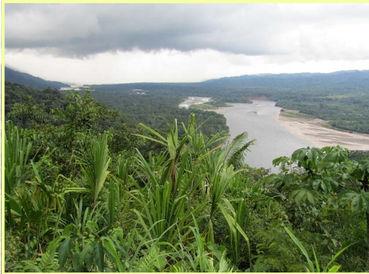
Selvas del río Manu

ellas levantaba con sus manos a su bebito, mostrándolo a la embarcación que pasaba. El vigilante nos informaba que era un bebito enfermo y con las manos malformadas. También, nos dice el vigilante, que uno de los mashco-piroos ahora coge piedras para tirarlas a las embarcaciones que no se detienen. Con la actitud que se está tomando por parte del Gobierno y de la FENAMAD contra esas gentes, de no darles ninguna ayuda, se está provocando la hostilidad, y no sería extraño que un día lancen una lluvia de flechas a una embarcación y alguien muera. ¿Quién será el responsable de esa muerte?