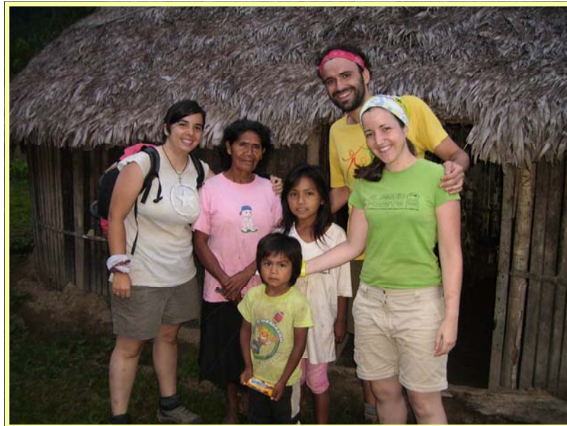
Voluntarios en Koribeni

Aunque les hubiese gustado seguir trabajan-